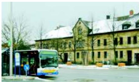
Bahnhofstr. 14 (Blick vom Bahnhof)

Bitte teilen Sie bei Ihrer Anmeldung zu einem Arzttermin dem Praxisteam kurz Ihr Anliegen mit, damit wir Ihnen die erforderliche Zeit widmen können. Bitte bringen Sie zu jedem Termin einen aktuellen Medikamentenplan und nach Möglichkeit auch aktuelle Vorbefunde mit.